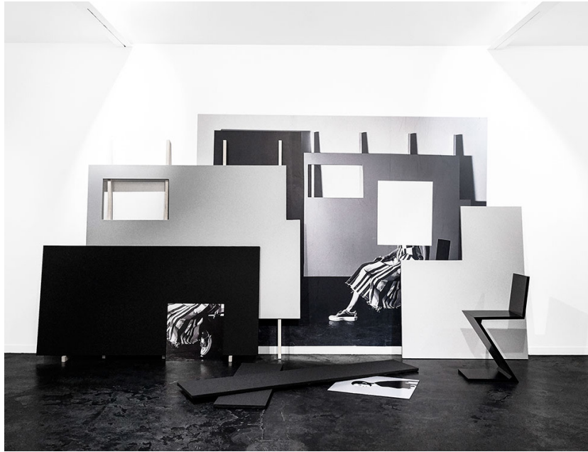
En haut : Quentin Lefranc, Arrangement en noir et gris, continuation Tom Greyhound, Paris, 2016. Toiles tendues sur châssis, peinture acrylique, tasseur de bois et contre-plaqué et intervention photographique de Molly SJ Lowe.