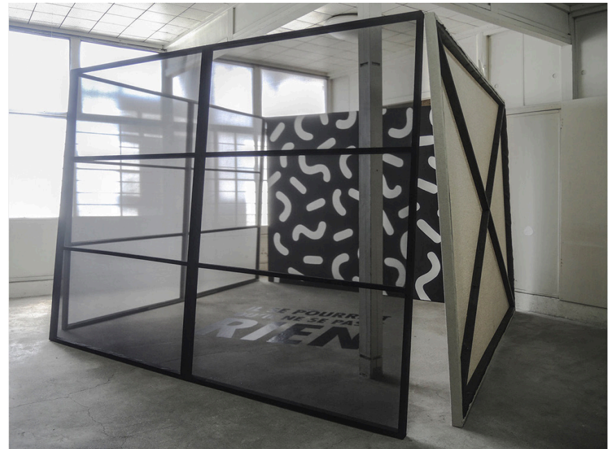
Ci-contre : Quentin Lefranc, Washitsu Avec l'intervention graphique de Marine Jezequel. Exposition Time Capsule , Takasaki, Japon, 2016. Bois peint, toile brute, voile polyester, vinyle.