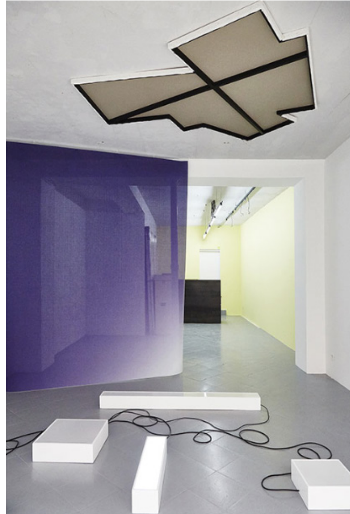
Quentin Lefranc, Beyond notation, Incomplete canvas et Background n°1 Exposition Exposed II , galerie Jérôme Pauchant, Paris, 2017.